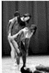
Spettacolo di Virgilio Sieni